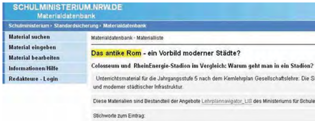
Abbildung 4: Eine direkte Suche in der Materialdatenbank ist möglich. Der Suchbegriff – hier „Das antike Rom“ – ist gelb hinterlegt.

Die Datenbank bietet auch die Möglichkeit per Stichwortsuche oder assoziativ mittels eines Kategoriensystems direkt nach weiteren Materialien zu recherchieren (siehe Abbildung 4 ).