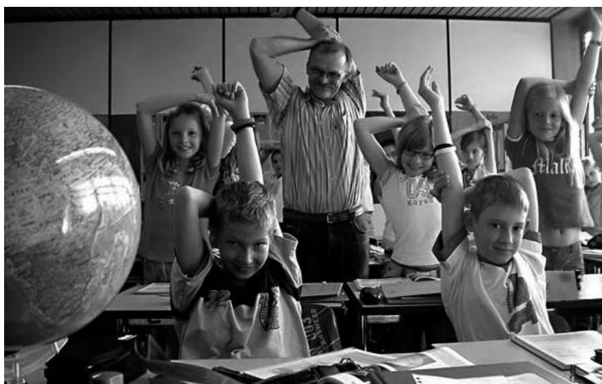
Abb. 2: Bewegungspause im Unterricht

Die Geschwister-Scholl-Schule ist eine von drei Realschulen der Stadt Gütersloh. Seit 1990 wird unsere Schule als Ganztagschule geführt. Die Schülerzahl für das Schuljahr 2008/09 beträgt 960, die von 73 Lehrkräften unterrichtet werden. Die Schule liegt in einem Schulzentrum, gemeinsam mit einer Haupt-