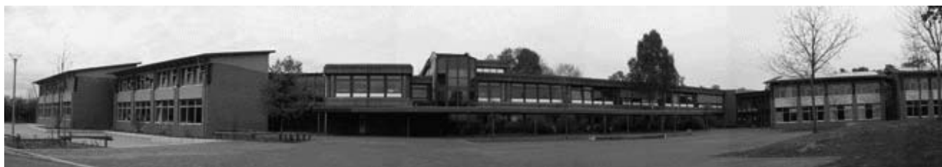
Abb. 1: Geschwister-Scholl-Schule in Gütersloh

Hinter der Leitidee „Bewegungsfreudige Schule“ steht die