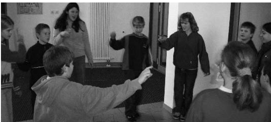
Abb. 3: „Schwingen“ von Silbenbögen

In der heutigen Zeit spielt Gesundheitsförderung in der Schule eine immer wichtigere Rolle. Bereits die jüngsten Schüler müssen im präventiven Sinne über Auswirkungen und Risiken von Fehlernährung, Bewegungsmangel und Stress aufgeklärt und für ein gesundheitsorientiertes selbstständiges Leben sensibilisiert werden. Die Geschwister-Scholl-Schule, die auch mit dem Schulentwicklungspreis „Gute gesunde Schu-