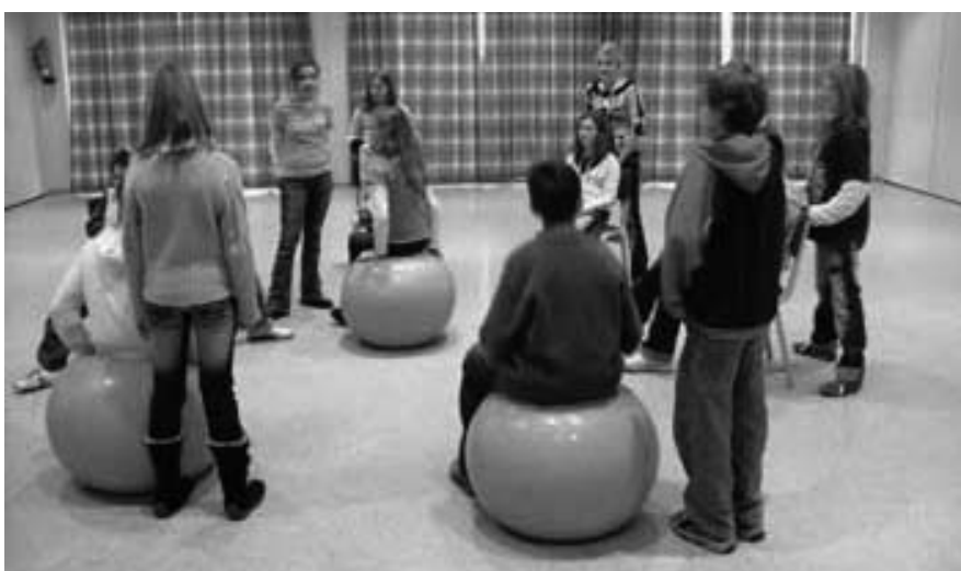
Abb. 5: Übungen zum Themenbereich „Rückenschule“

In Zusammenarbeit mit dem Praevikusteam (Ärzte, Psychologen, Sportwissenschaftler, Heil- und Sozialpädagogen, Erzieher sowie Physiotherapeuten) lernen die Kinder praktisch und selbstentdeckend wichtige Inhalte über ausgewogene Ernährung, Bewegung und Stressbewältigung in der Gesundheitswoche kennen. Die Grundlagen hierfür werden fächerübergreifend vorher im Unterricht