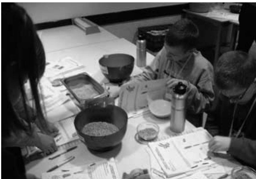
Abb. 4: Gruppenarbeit zum Thema „Gesunde Ernährung“

le“ ausgezeichnet wurde, sucht dabei ständig nach Möglichkeiten, diesen Forderungen gerecht zu werden.