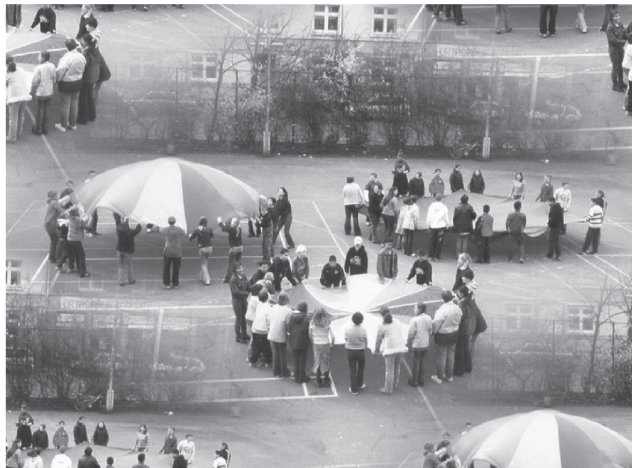
Abb. 1: Kooperationen am Fallschirm

Eine erfolgreiche und kontinuierliche Zusammenarbeit besteht bereits seit 2001 mit dem Hermer Turnclub 1880 e.V. im Bereich der Ganztagsangebote. Begonnen hat die Kooperation zwischen unserer Schule und diesem Sportverein mit dem Projekt 13Plus. Seit 2006 ist die Zusammenarbeit im Rahmen