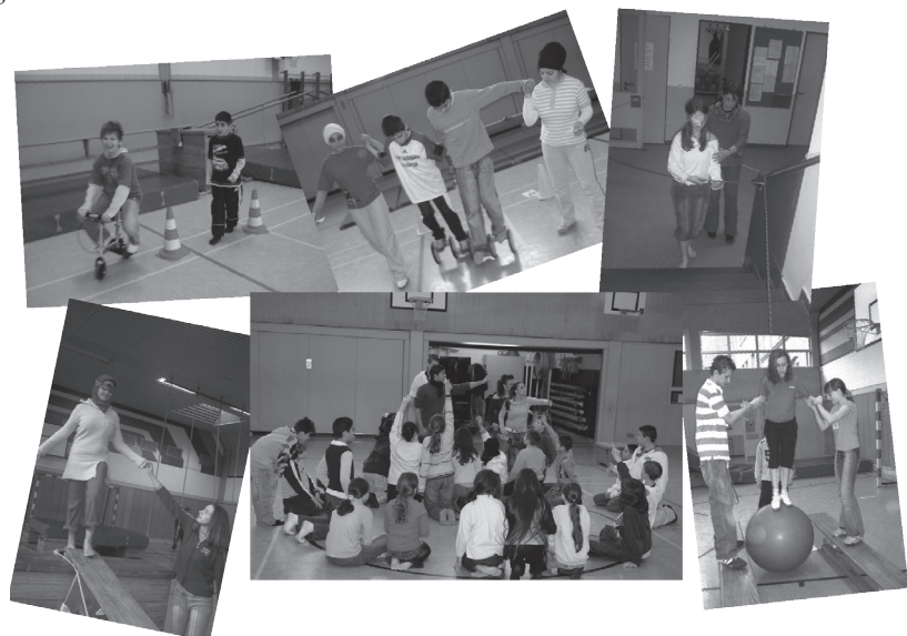
Abb. 6: Unsere bewegungsfreudige Hauptschule