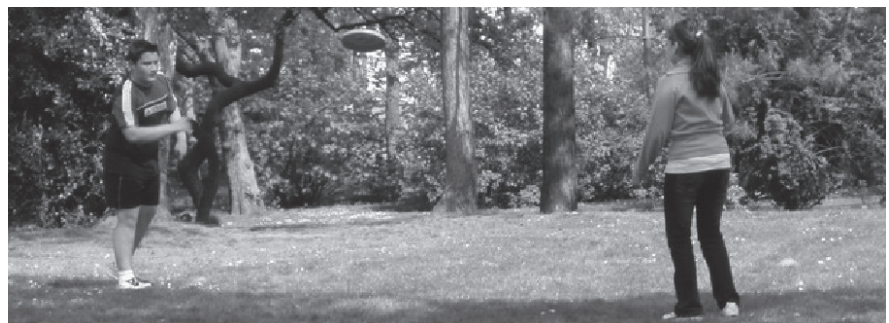
Abb. 2: Frisbeeübung für Handreichung

der Umgestaltung der Schule in eine Ganztagschule vertieft worden. Im Rahmen einer Kooperationsvereinbarung erhält der HTC 1880 e.V. für seine Bewegungs-, Spiel- und Sportangebote ca. 2/3 der zur Verfügung stehenden Mittel aus einer kapitalisierten Lehrerstelle.