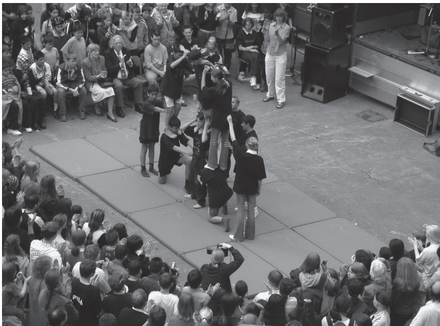
Abb. 5: Schulsportveranstaltung auf dem Schulhof